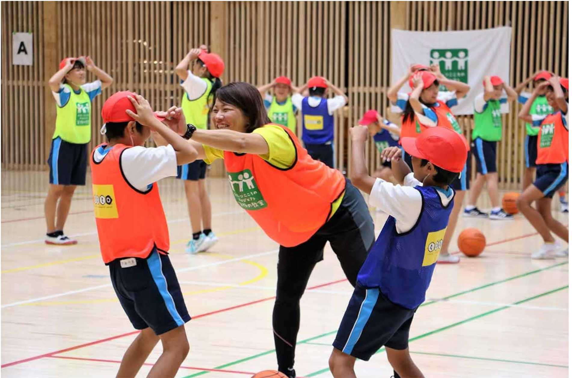
体育館で体を動かす子どもたち