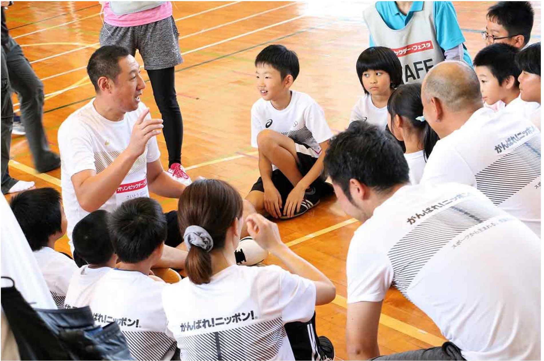
アスリートとふれあう子どもたち

この日のイベントには、中村真衣さん（水泳／シドニー2000大会）、杉本美香さん（柔道／ロンドン2012大会）をはじめ計6名のオリンピックが、約100名の地元住民の方々とスポーツを通じて交流し、笑顔を浮かべていました。