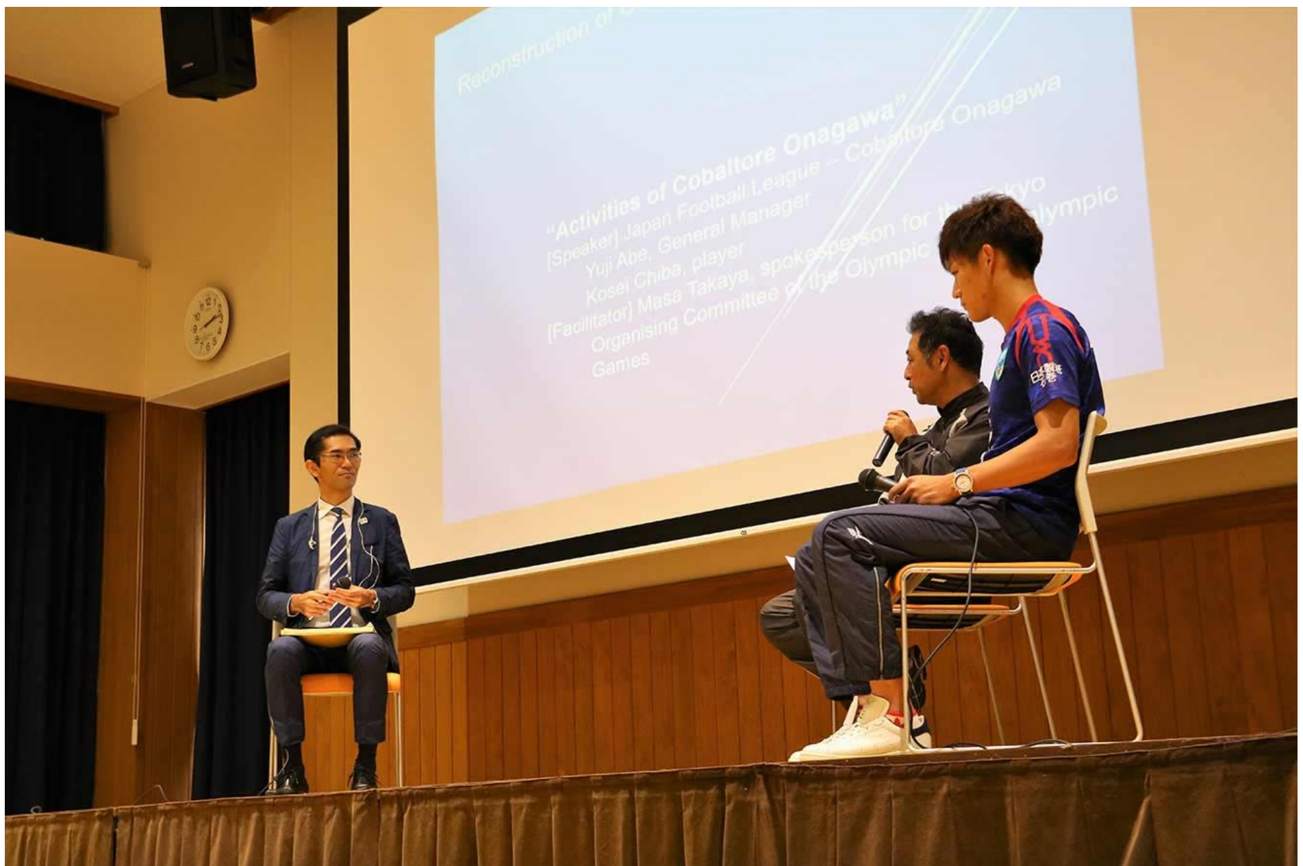
コバルトーレ女川とのトークセッション

ツアー参加者はバスの中で宮城県の食材を使用したお弁当を食べ、3つ目の訪問地である宮城県女川町へと向かいました。女川町は、東日本大震災で最大規模の被害を受けましたが、中心部に商店街や病院などの都市機能を集中させる復興まちづくりを進め、2015年3月にはJR石巻線全線再開とともに新しい女川駅が完成し、12月には商業施設もオープンしました。