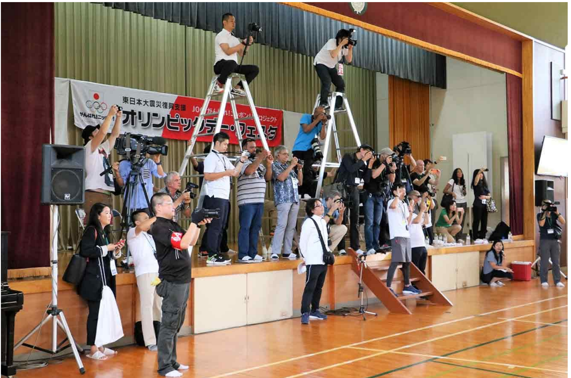
撮影する海外メディア