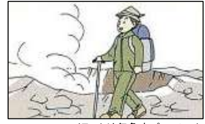
イラストは気象庁パンフレットより