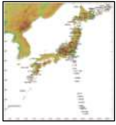
全国110箇所の 活火山を対象