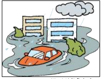
イラストは気象庁パンフレットより