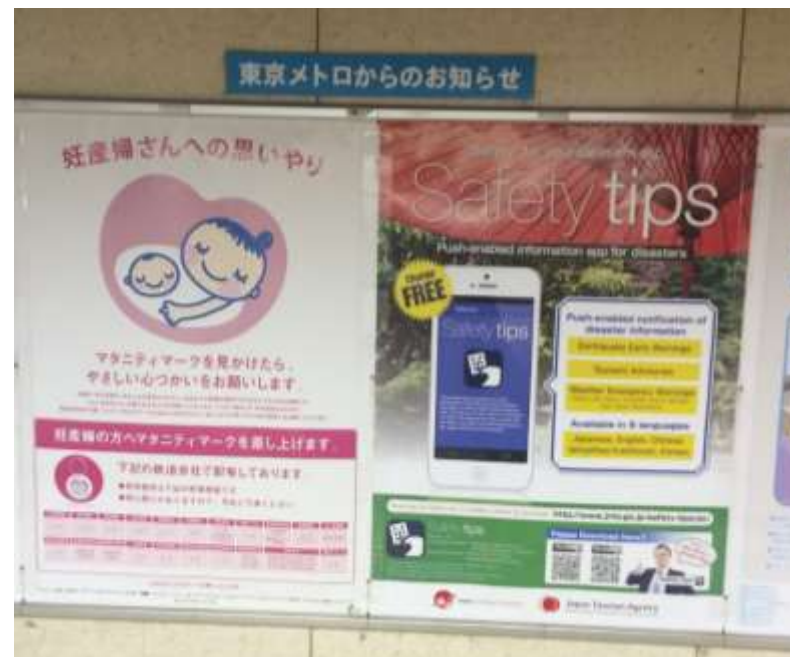
【東京メトロ掲出の様子】