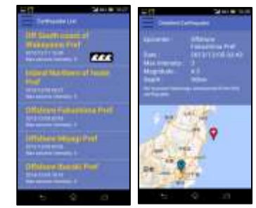
地震（震度3以上）・津波情報も見ることができます