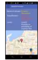
位置図などの詳細