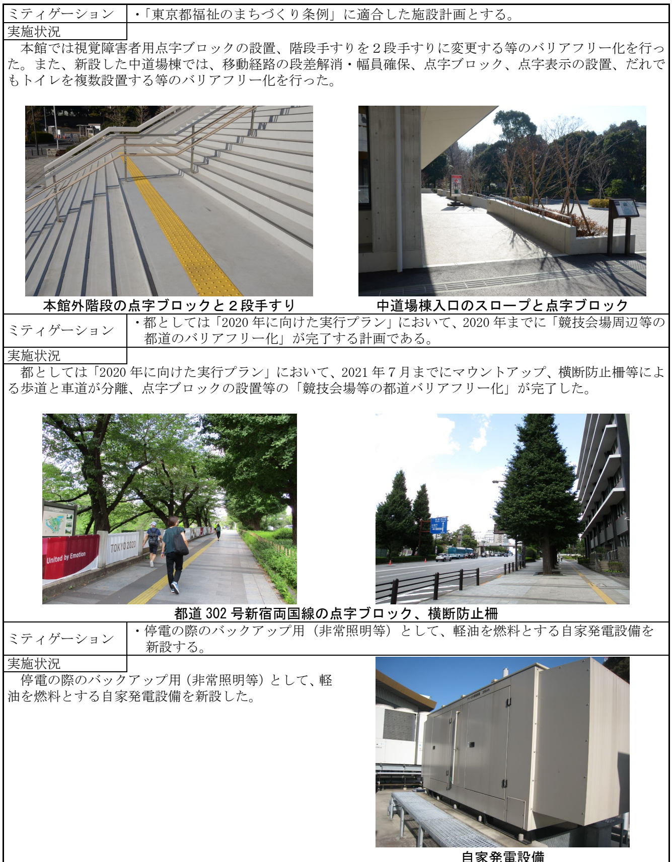
表8.10-5(1) ミティゲーションの実施状況(東京2020大会の開催後)

ミティゲーションの実施状況は、表 8.10-5(1) 及び(2) に示すとおりである。なお、安全に関する問合せはなかった。