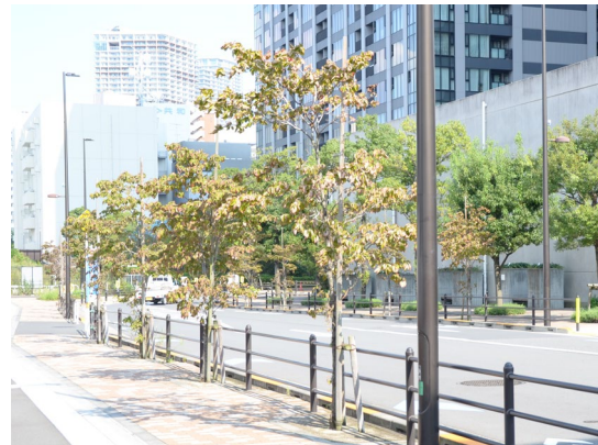
②特別区道江 609 号