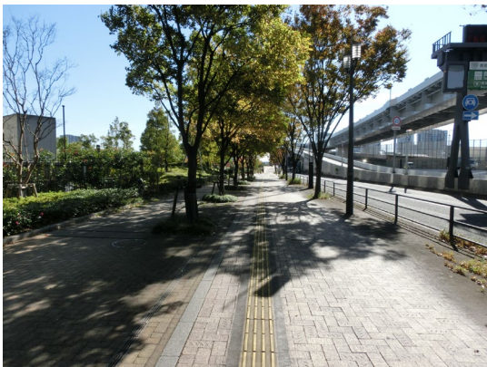
①都道 304 号日比谷豊洲埠頭東雲町線（有明通り）

これら計画地内の緑地の整備により、今後、新たに緑陰が創出され、歩行者空間の快適性が向上するものと考えられる。