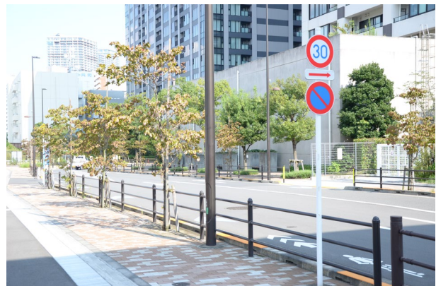
特別区道江 609 号の街路樹