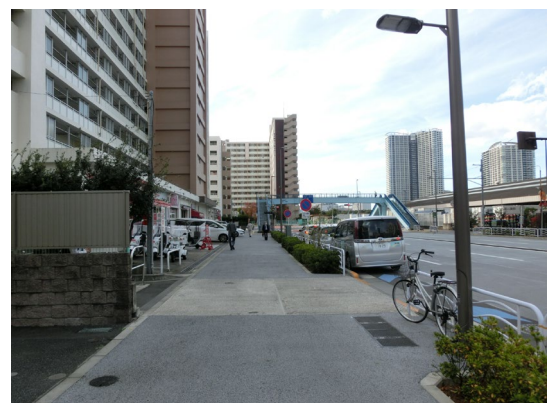
④特別区道江 617 号