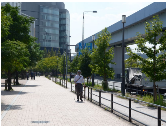
③都道 484 号豊洲有明線