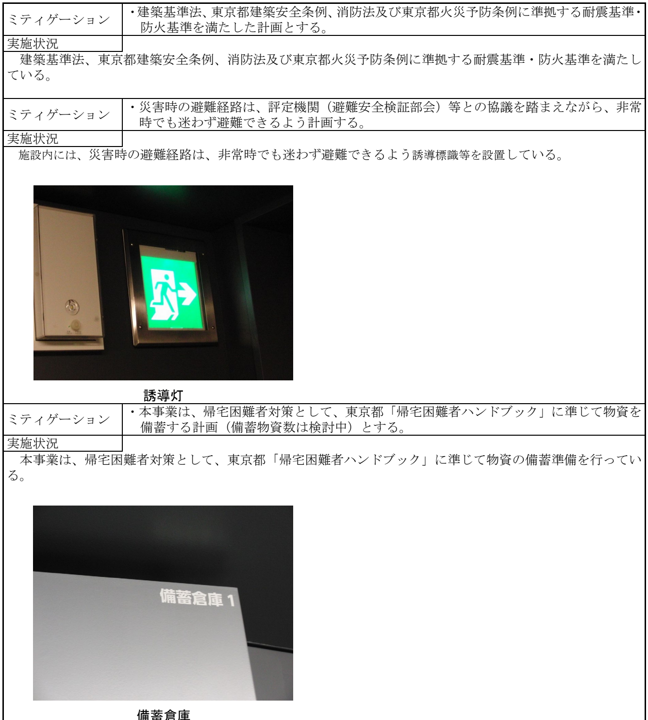
表8.13-8 ミティゲーションの実施状況(東京2020大会の開催後)

ミティゲーションの実施状況は、表 8.13-8 に示すとおりである。なお、消防・防災に関する問合せはなかった。