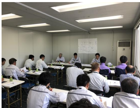
写真 8.4.3-2 工程会議の様子