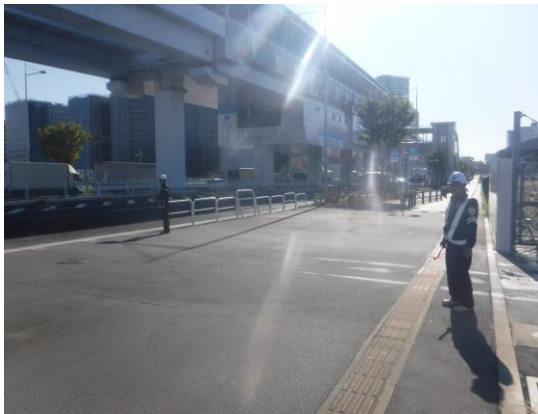
写真 8.4.4-3 交通整理員