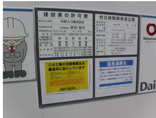
写真 8.4.2-4 近隣窓口問合わせ先掲示板