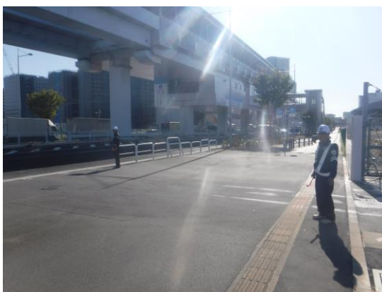
写真 8.4.3-3 交通整理員の配置