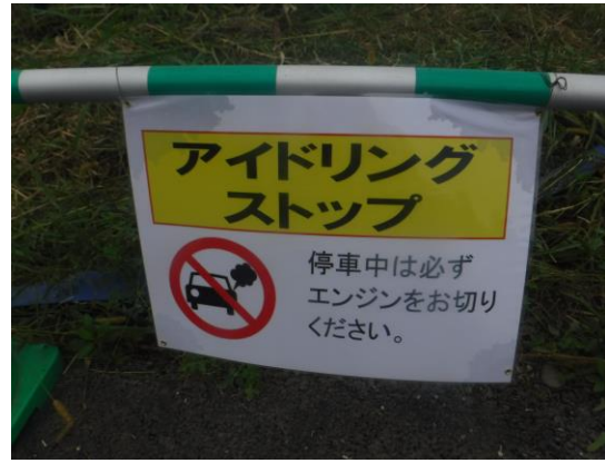
写真 8.4.2-2 アイドリングストップの掲示