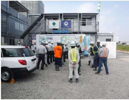
写真 8.4.4-1 朝礼の様子