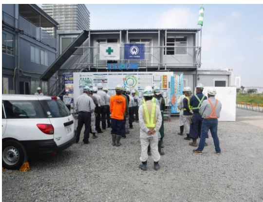
写真 8.4.3-1 朝礼の様子