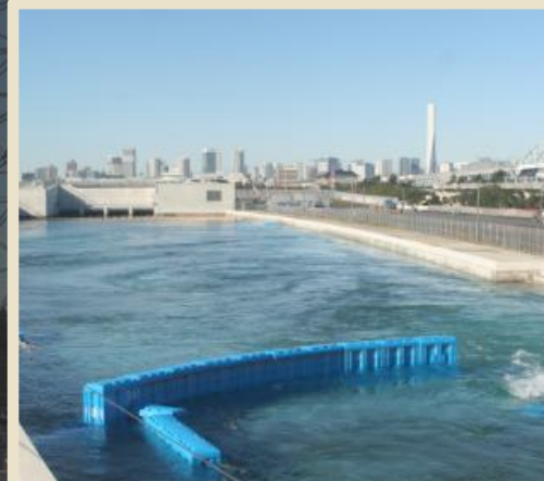
フィニッシュプール