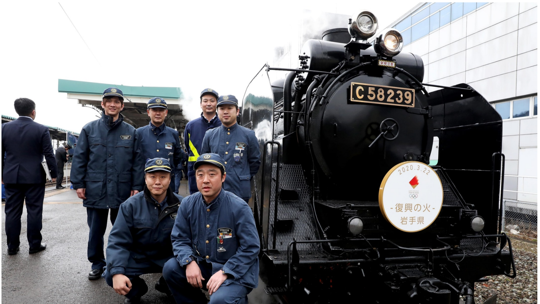
2020年3月22日（日）、岩手県釜石市の釜石駅にて「復興の火」を運んだJR東日本のSL銀河