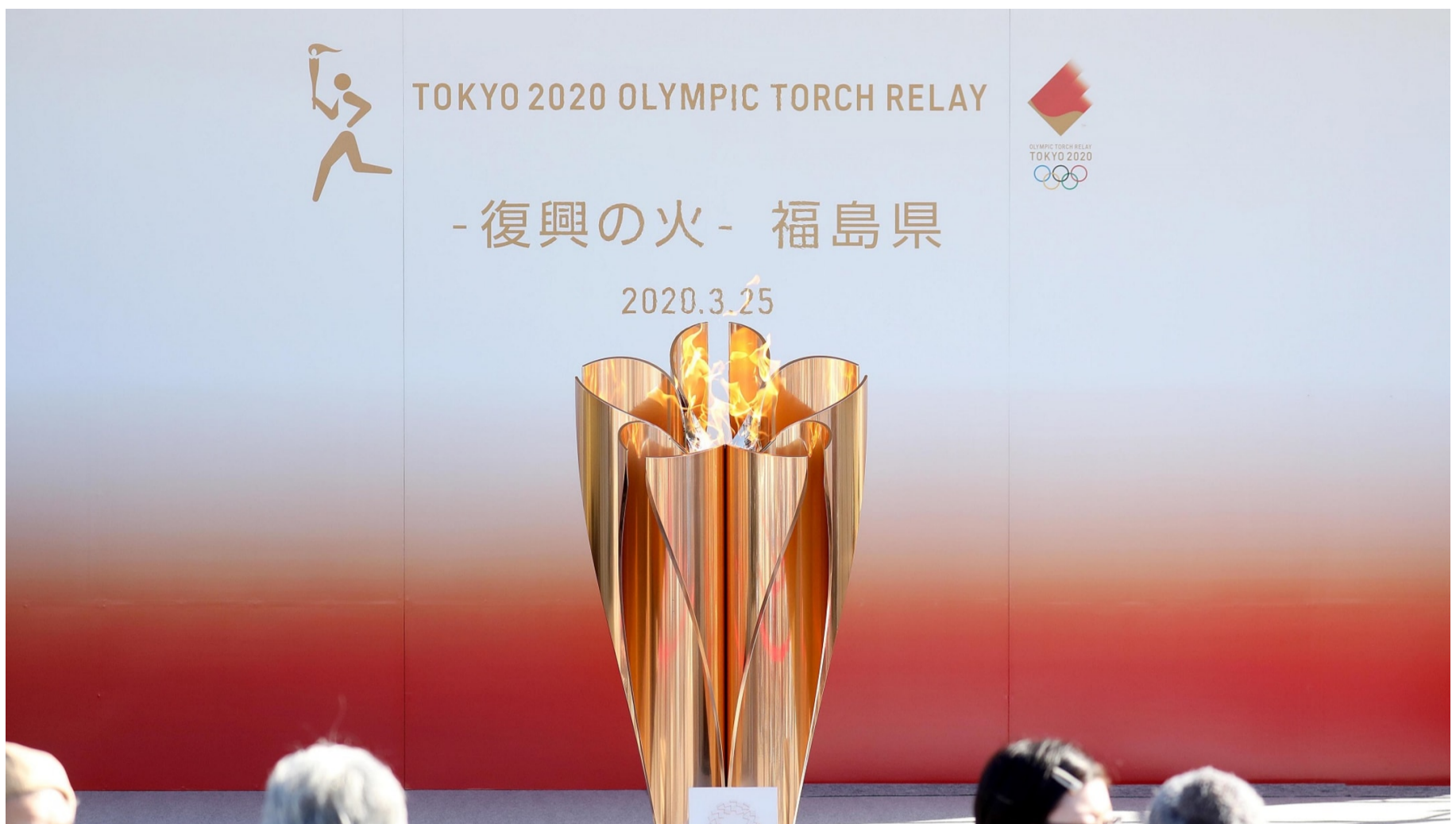
2020年3月25日（水）、福島県いわき市にて展示された「復興の火」

組織委員会について お問い合わせ ウェブアクセシビリティについて リンク 利用規約 個人情報保護方針 クッキーポリシー サイトご利用にあたって サイトマップ 報道関係者の方へ