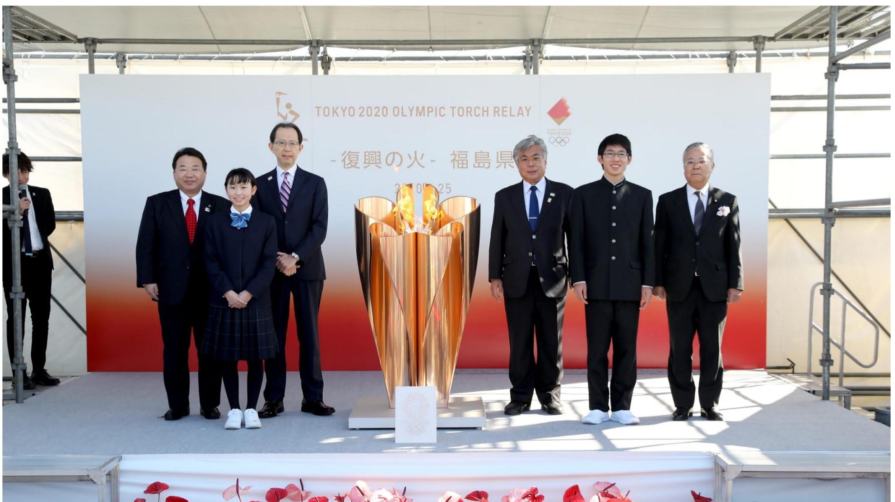
2020年3月25日（水）、福島県いわき市での「復興の火」セレモニー

環境水族館「アクアマリンふくしま」や観光物産センター「いわき・ら・ら・ミュウ」などが集まるいわき市の観光・交流の拠点。「アクアマリンふくしま」は東日本大震災により甚大な被害を受けましたが、2011年7月15日に再オープンを果たし、いわき市の復興のシンボルとなっています。こちらではセレモニーと「復興の火」の展示・観覧を行いました。