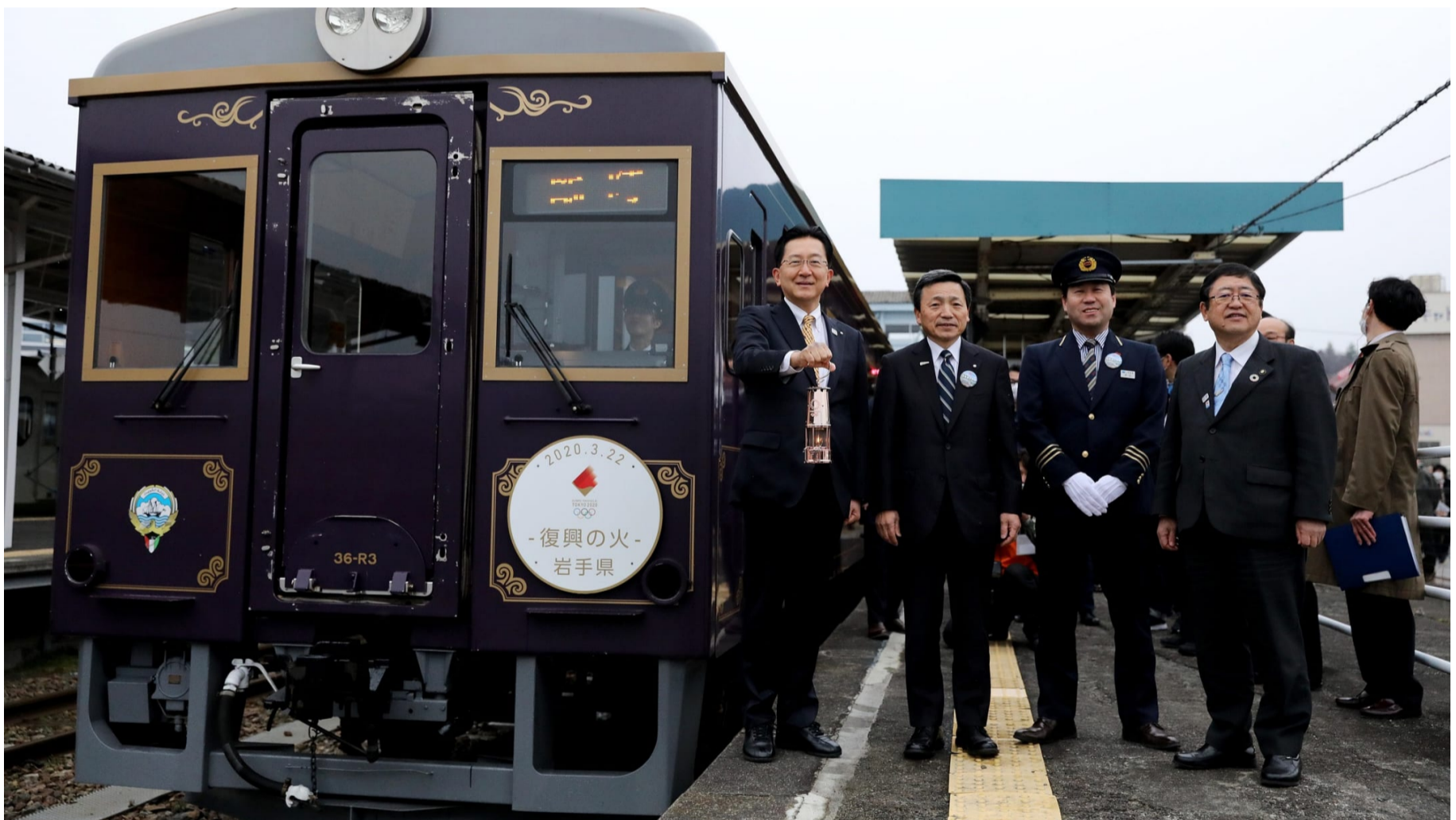
2020年3月22日（日）、岩手県宮古市の宮古駅にて「復興の火」を運んだ三陸鉄道の車両

大船渡市は東日本大震災で震度6弱を観測し、津波によって市の中心市街地が被災しました。津波復興拠点整備事業区域である当該エリアに、2017年、被災事業者等の再建商業施設「キャッセン大船渡」が開業、2018年6月には防災観光交流センター「おおふなぼーと」がオープンしました。こちらではセレモニー、「復興の火」展示・観覧を行いました。