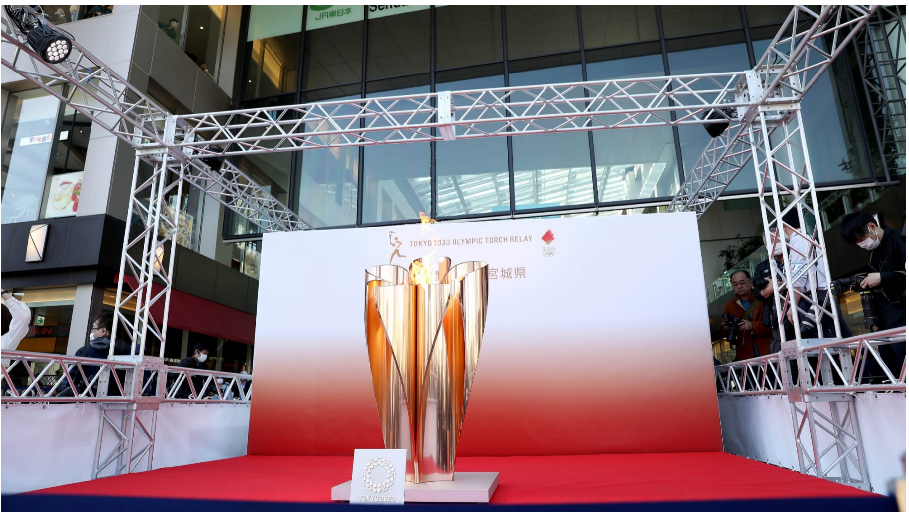
2020年3月21日（土）に宮城県の仙台駅前で展示された「復興の火」