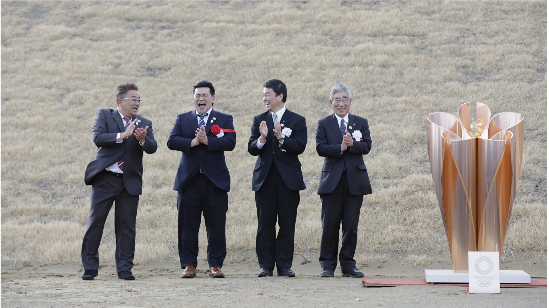
2020年3月20日（金）、宮城県石巻市での「復興の火」セレモニー

東日本大震災発生当時、構内が損壊したため県内の主要鉄道機関が利用不能になりました。仙台駅東口エリアが位置する仙台市宮城野区は仙台市内で最も強い震度6強を記録したほか、隣接する同市若林区とともに海岸部は甚大な津波被害を受けた場所です。こちらでは式典と「復興の火」展示・観覧を行いました。