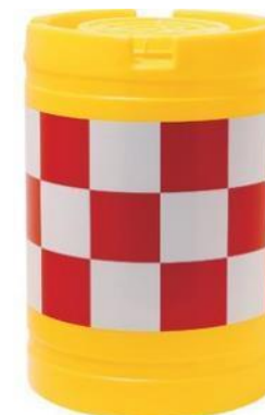
衝突衝撃緩衝具 (道路分岐に設置)