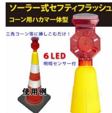
セーフティフラッシュ (夜間交通対策)