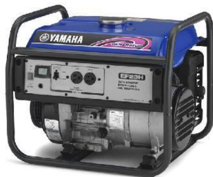
発電機 (テント内、駐車場等に設置)