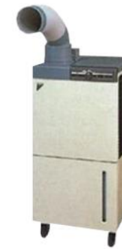
スポットクーラー (暑さ対策)