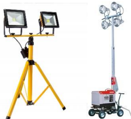
投光器 (駐車場等に設置)