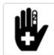
救護所 First aid