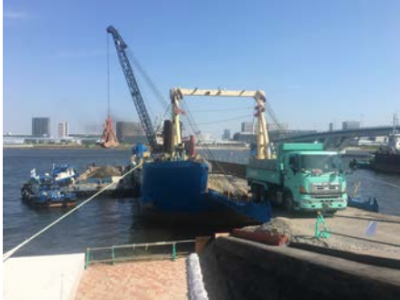
写真 6.8.7-3 海上輸送