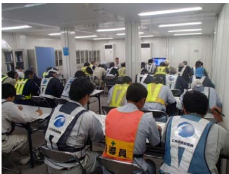
写真 6.8.7-7 安全教育