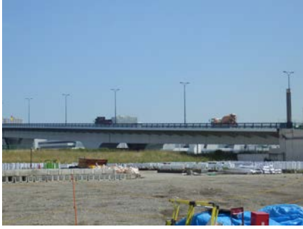
写真 6.8.7-1 環状二号線晴海～豊洲間利用