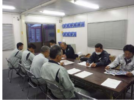
写真 6.8.7-2 工程会議