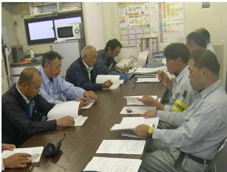
写真 6.8.7-5 定例会議