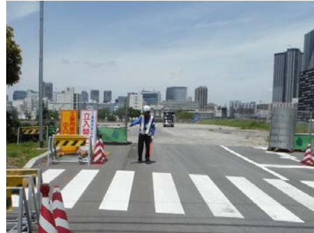
写真 6.8.7-4 交通整理員