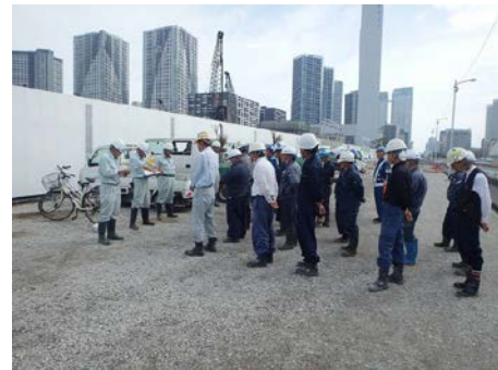
写真 6.8.7-6 朝礼