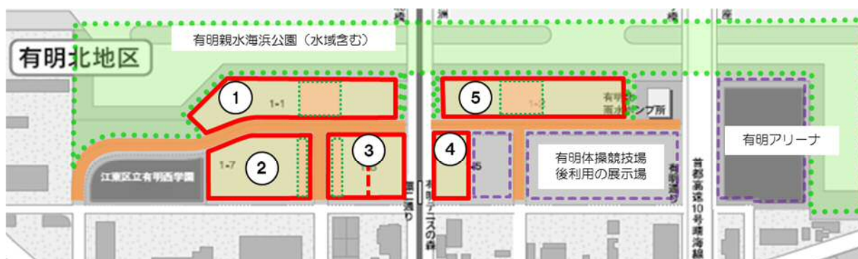
表2 各区画の面積及び制限事項