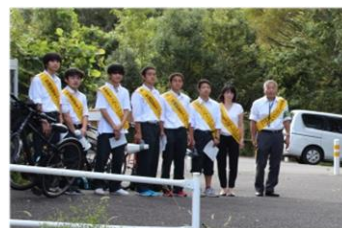
<ボランティアマインド> [2]