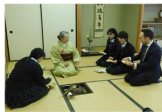
<日本人としての自覚と誇り> [5]